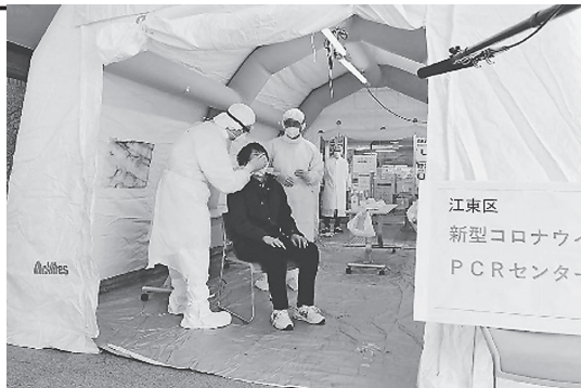
東京都江東区が同区医師会と連携して設置したPCRセンター